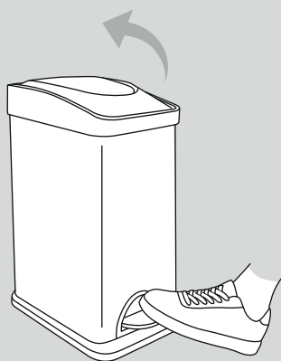
Para abrir a tampa bata acionar o pedal.